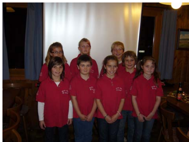
Die Neuzugänge für den Ba-Wü- und Förderkader

Für die neue Saison stellt der WRIV 5 Sportlerinnen und 4 Sportler in die Nationalmannschaft bzw. den Perspektivkader sowie 2 Sportler in das Downhill-Team des DRIV.