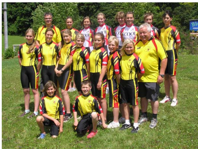
Sportler/Innen des Ba-Wü-Kaders und der Inline-Alpin-Nationalmannschaft

Ende 2008 – und dies gilt bereits für die neue Saison 2009 - konnten im Ba-Wü-Kader 17 Sportler/Innen und im neu gegründeten Förderkader 7 Sportler/Innen verzeichnet werden.